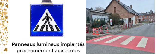
Panneaux lumineux implantés prochainement aux écoles